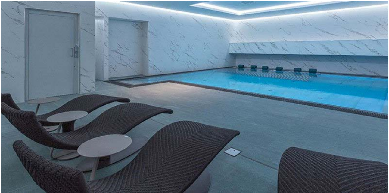
Sala prospiciente la piscina

Dopo una sauna o un bagno nell'idromassaggio, le sale relax sono il luogo ideale per riposarsi, leggere ed ascoltare il silenzio: nel progetto del centro benessere, sono presenti tre sale, di cui due silenziose e una prospiciente la piscina.