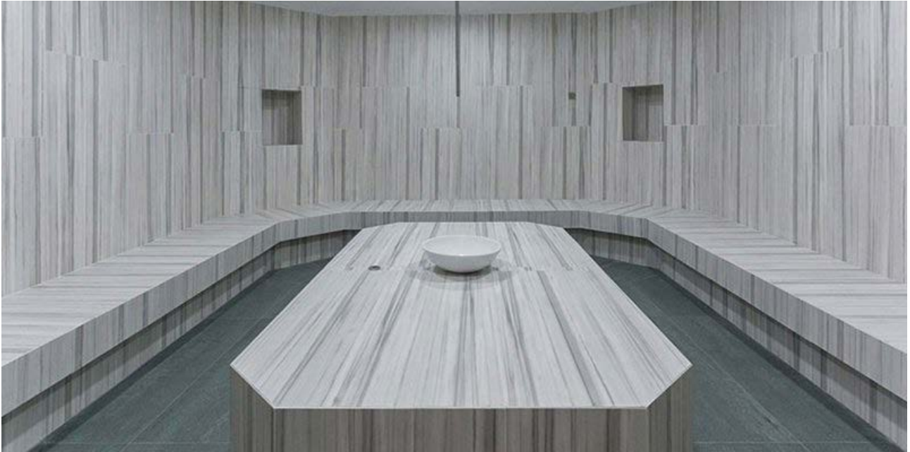
Marmoker Zebrino 59x118 cm

Il bagno turco , interamente rivestito da gres porcellanato effetto marmo della collezione Marmoker color Zebrino , si presenta con una struttura ottagonale con al centro una fonte d'acqua e ai lati delle sedute, alcune nicchie che ne arricchiscono lo spazio.