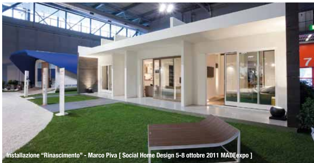
Installazione "Rinascimento" - Marco Piva [ Social Home Design 5-8 ottobre 2011 MADEexpo ]

Per info e aggiornamenti www.hsdesign.it