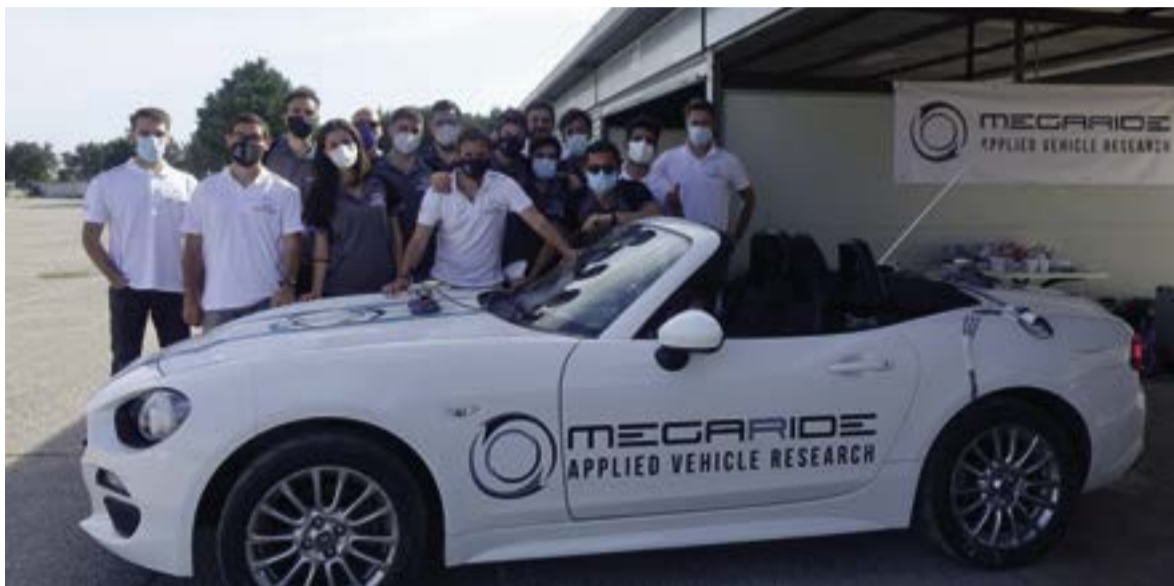
La startup MegaRide

Tornando allo pneumatico, elemento cruciale nel motorsport contemporaneo per il proprio ruolo nell'aderenza con la strada, a sua volta unico reale obiettivo da massimizzare attraverso appendici aerodinamiche, elastocinematiche sospensive e opportune distribuzioni delle coppie erogate dal motore, la sua analisi racchiude alcune tra le maggiori difficoltà tecniche del settore automotive, a causa delle profonde non linearità