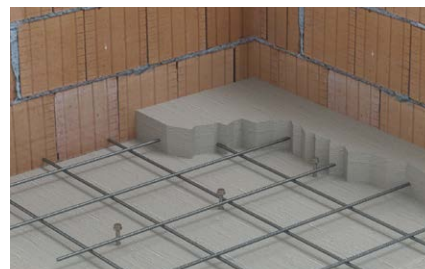
Dettaglio vite FBS II utilizzata come connettore