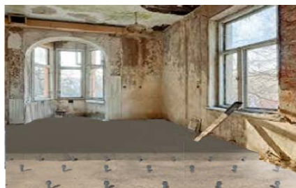
Rinforzo di solaio in calcestruzzo